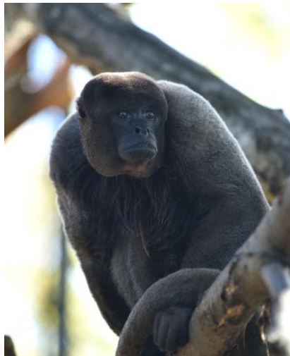
Singe laineux et Manchot de Humboldt

Découverte et initiation par des professionnels tous les jours en accès libre toutes les 30 minutes. Démonstrations exceptionnelles : 10 mn de show-performances « sur les traces des Yamakasi » - samedi 22 et dimanche 23, samedi 29 à 18h et dimanche 30 à 16h30.